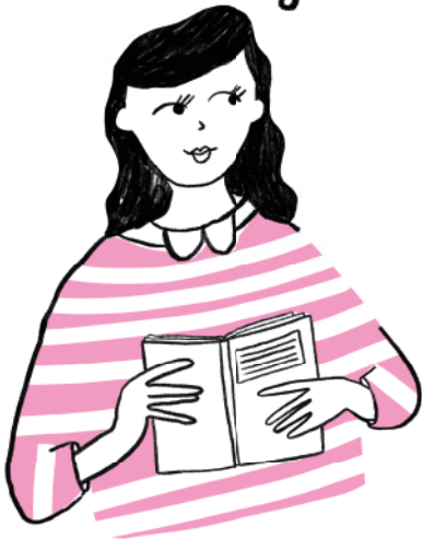
Der Erhebungsbogen des IVDP

beitragen, dass wir Patientinnen und Patienten mit entsprechendem Risiko für psychische Komorbiditäten früher erkennen und ihnen rechtzeitig helfen können.